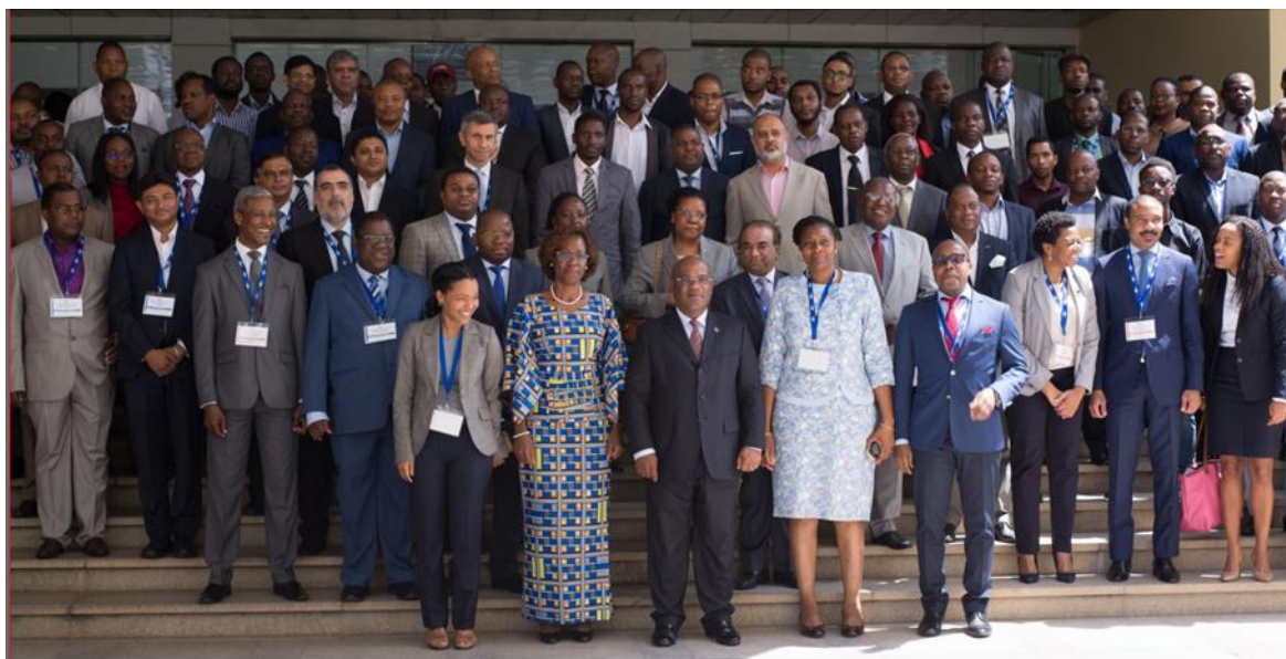
Foto de Família da 1ª Conferencia Nacional de Segurança Cibernética, Maputo Novembro de 2018

Mostrando que a preocupação sobre este assunto é transversal a toda a nação, o Presidente da República de Moçambique, Filipe Jacinto Nyusi, referiu-se a esta temática na comunicação que proferiu durante a cerimónia de graduação em Ciências Policiais, a seguinte citação: “... Outra questão para a qual gostaríamos de chamar a vossa atenção prende-se com a prevenção e combate aos crimes cibernéticos. Esta é uma realidade atípica, mas, cada vez mais actual e com efeitos perversos, dada a sua rápida propagação e a dificuldade de reparação dos danos... ”.