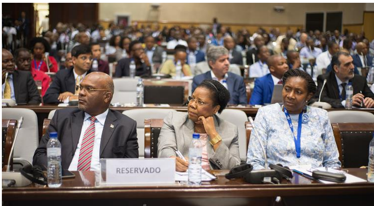
A atenção que dominou durante as sessões da 1ª Conferencia, Maputo Novembro de 2018